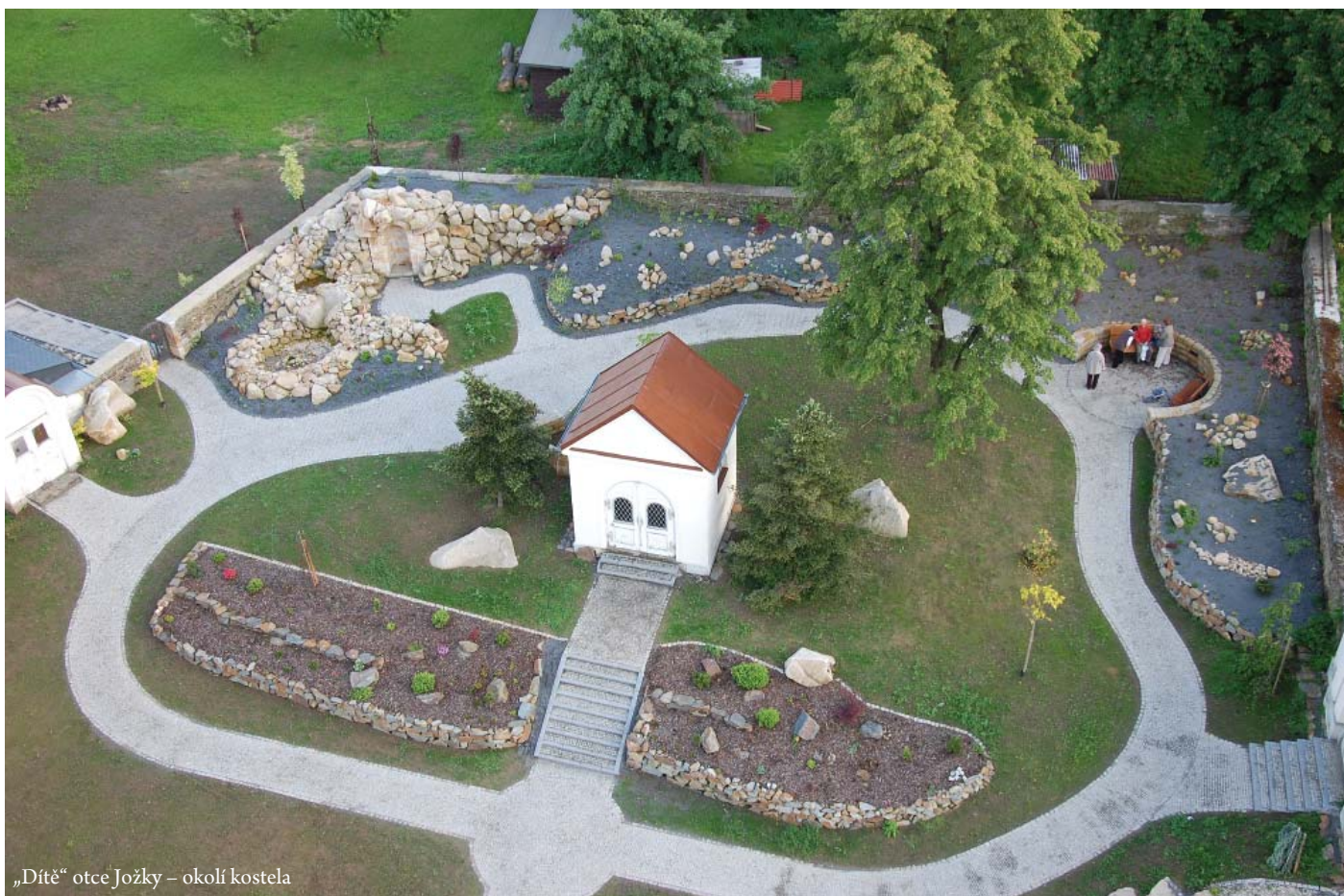
„Dítě“ otce Jožky – okolí kostela