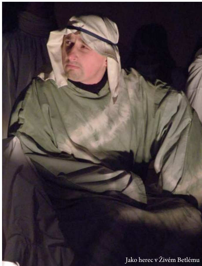
Jako herec v Živém Betlému